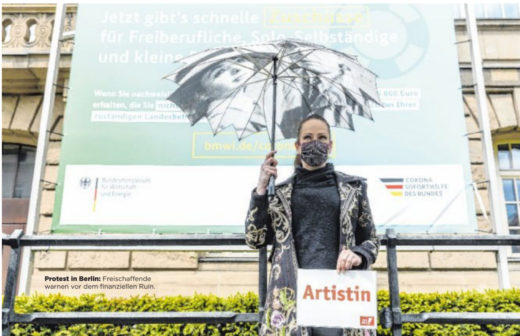
Protest in Berlin: Freischaffende warnen vor dem finanziellen Ruin.